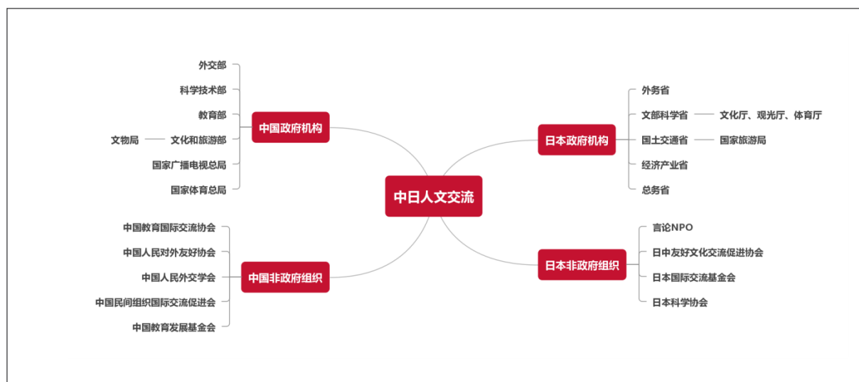
图1 中日人文交流相关机构

中日人文交流由官方和民间共同推动。在官方层面，中方的主要机构包括外交部、教育部、科学技术部、文化和旅游部、国家广播电视总局、国家体育总局等；日方的主要机构包括外务省、文部科学省、经济产业省、国土交通省、总务省等。在民间层面，两国也有许多非政府组织积极参与人文交流实践。中方的组织主要有中国教育国际交流协会、中国人民对外友好协会、中国人民外交学会、中国教育发展基金会、中国民间组织国际交流促进会等；日方的组织主要有言论 NPO、日中友好文化交流促进协会、日本科学协会、日本国际交流基金会等。