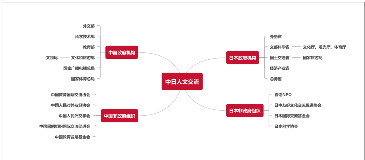
图1 中日人文交流相关机构

中日人文交流由官方和民间共同推动。在官方层面，中方的主要机构包括外交部、教育部、科学技术部、文化和旅游部、国家广播电视总局、国家体育总局等；日方的主要机构包括外务省、文部科学省、经济产业省、国土交通省、总务省等。在民间层面，两国也有许多非政府组织积极参与人文交流实践。中方的组织主要有中国教育国际交流协会、中国人民对外友好协会、中国人民外交学会、中国教育发展基金会、中国民间组织国际交流促进会等；日方的组织主要有言论 NPO、日中友好文化交流促进协会、日本科学协会、日本国际交流基金会等。